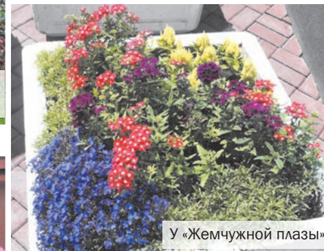
У «Жемчужной плазы»

Муниципальные цветники в Красном Селе расположены на ул. Гвардейской, 19/1, Красногородской, 19/1 и 1, Бронетанковой, 13/2 и 10, Спирина, 16, 18, 9/1, Массальского, 5, Свободы, 52, Гатчинском шоссе, 13/2, Кингисеппском шоссе, 10/1-10/2, Пушкинском шоссе, 1а, пр. Ленина, 92-98, 55