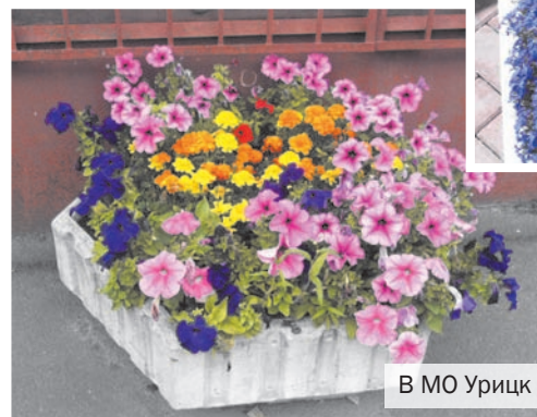
В МО Урицк

Дело, как нам кажется, в недобросовестности, помноженной на непрофессионализм. Из года в год в наших муниципальных образованиях цветниками занимаются компании, не имеющие отношения к цветоводству. Поэтому и не могут совместить цветы по видам и сортам, правильно их посадить и добиться хорошего цветения. Да и не очень хочется. Ведь контракты на посадку цветов выигрывают, кажется, не ради красоты, а чтобы как-то на этом заработать. Что касается Красного Села, маржа с данной статьи в этом году получилась роскошной. Судите сами. Если поделить все цветы, предусмотренные для посадки в муниципальном образовании, по-честному, по каждому адресу должно быть не меньше 700 растений, а набирается не больше