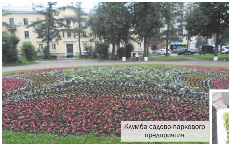
Клумба садово-паркового предприятия

Муниципальные цветники в Горелово расположены на Красносельском шоссе, 46/4, 46, 36-42, 40; ул. Коммунаров, 118/1, 118 и 120-122; ул. Школьной, 45; ул. П. Пасечника, 3, 10, 1к.2-1/3, 8-10, 10, 20 и у местного мемориала