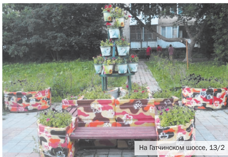
На Гатчинском шоссе, 13/2